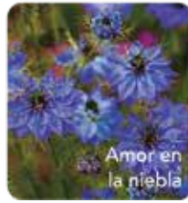
Amor en la niebla