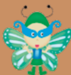
Super ayudante de hierba