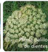
Planta palillo de dientes